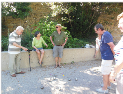
partie de pétanque

Retrouvez plus d'informations et participez sur la plateforme, lien direct vers la fiche action : https://www.cestpossible.me/action/equipages-un-espace-seniors-et-intergenerationnel/