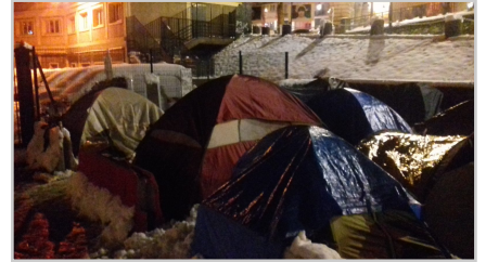
des conditions difficiles

Retrouvez plus d'informations et participez sur la plateforme, lien direct vers la fiche action :