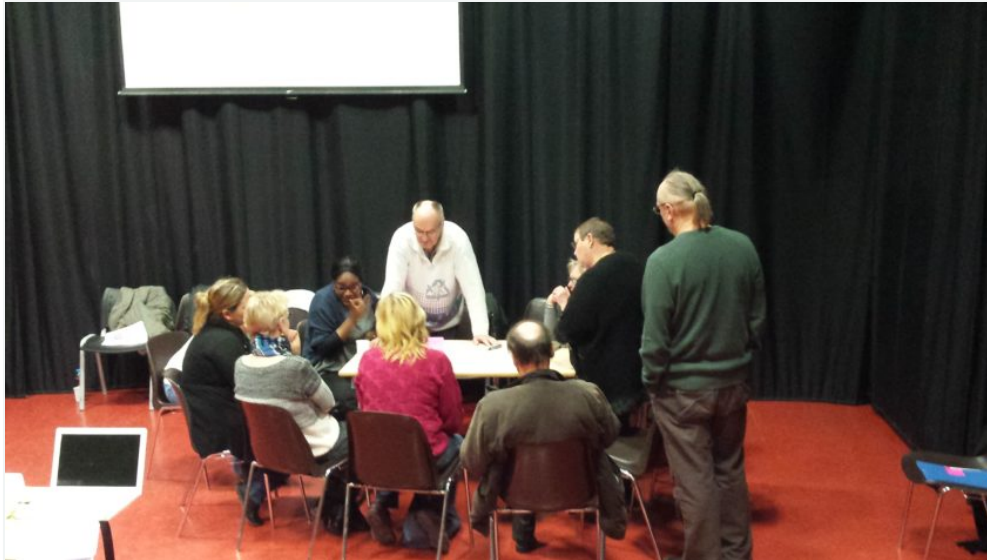
Table de quartier d'Etouvie