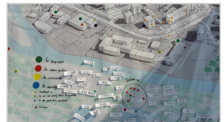
Jeu de la carte d'Étouvie à la fête d'automne

Magazine d'Amiens-Métropole 5 octobre 2016