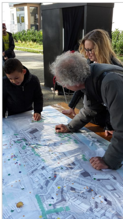
Découvrir le quartier à tout âge et donner des appréciations