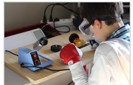
Soudure et robotique