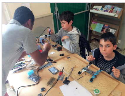
Construire des drones de course