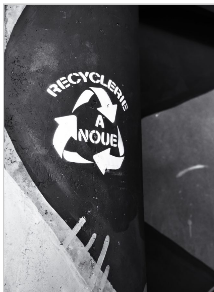
recyclerie déco locale