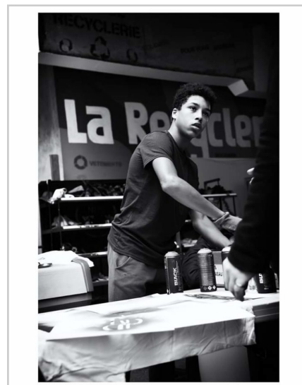
technique du pochoir pour customisation de tee-shirt