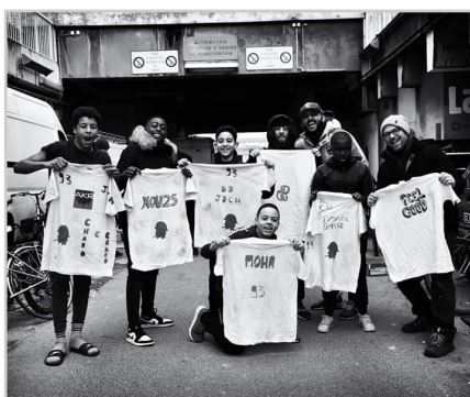
la team gagnante, nos jeunes bénévoles